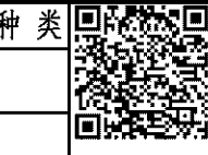
图 幅: 0.25 A1